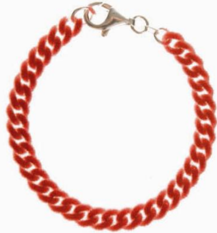
Velour bracelet Red 5.1 mm