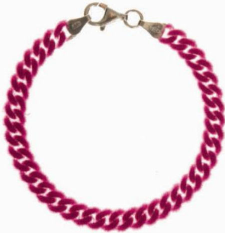
Velour bracelet Fuscia 4.85 mm